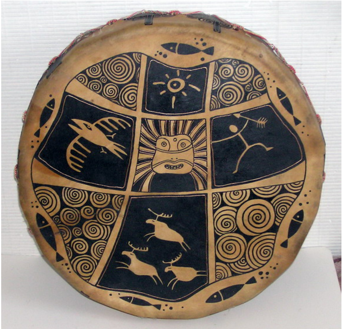
Рис. 2. Дух помещают сверху. Тень - снизу. Прошлое - слева. Будущее - справа. Зерцало располагают в центре.