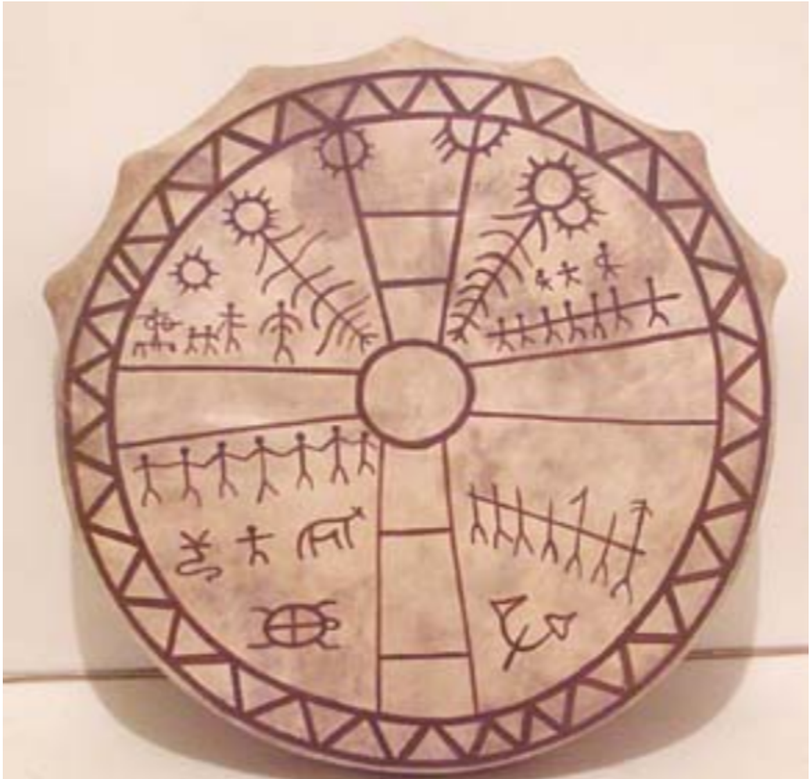
Рис. 1. Иллюстрация концепции пяти тел, изображённая на шаманском бубне.